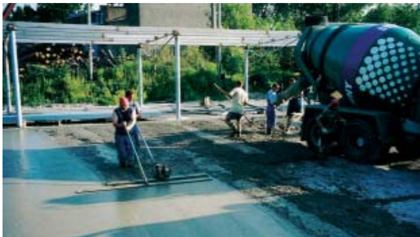
Fig. 2 Pouring and vibrating of fibre reinforced concrete truck parking area