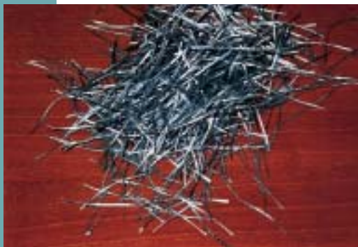
Obr. 1 Výztužná vlákna BeneSteel 80/55 Fig. 1 Fibre reinforcement BeneSteel 80/55

V posledních letech se v zahraničí, zvláště v USA, široce uplatňují nové typy syntetických výztužných vláken. Během uplynulého roku byla u nás realizována řada průmyslových podlah z vláknobetonu se syntetickými vlákny patřícími do této nové skupiny vláken.